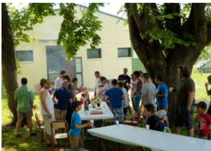
Moment de convivialité sous les tilleuls

Le judo sport de famille, la photo ci-contre le confirme bien.