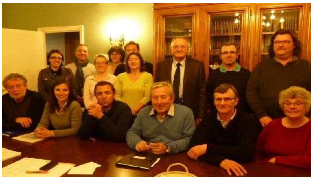
Le Conseil Municipal Mars 2014

Une équipe renouvelée par le scrutin municipal du 23 Mars 2014 dès le 1 er tour.