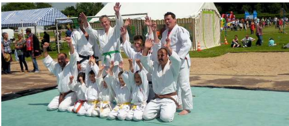
Le club de judo était présent à la journée des sports à la Croix Saint Leufroy le 15 juin 2014

Nous avons terminé l'année par un moment de convivialité fort apprécié par les personnes présentes. En effet, le dimanche 22 juin le club a organisé son traditionnel challenge de fin de saison. Le temps très clément nous a permis d'installer tables et barbecue sous les tilleuls devant la salle, saucisses et merguez et côtes de porc ont régalé les convives.